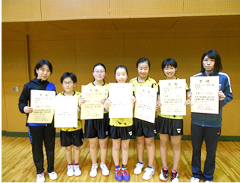
スポ少フェスティバル予選・優勝の青潮A