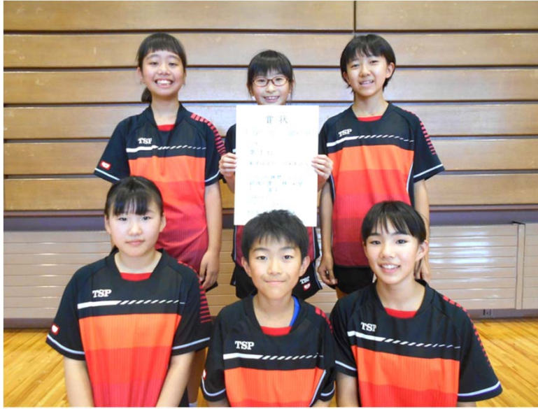
スポ少フェスティバル予選・優勝の新井田A